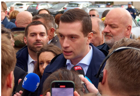
Jordan Bardella před volbami, 23. marca 2024

Bardellovi prarodiče byli jednou z posledních rodin, které v šedesátých letech minulého století využily francouzsko-italské migrační dohody z roku 1947. Ta měla řešit problémy obou zemí: Itálie trpěla masovou nezaměstnaností, zatímco Francie nutně potřebovala dělníky na poválečnou obnovu. Stát organizoval vše od lékařských prohlídek po ubytování. Bardellovi dostali na začátku malý byt s jednou místností a společným záchodem na dvoře. Dědeček byl zaměstnaný jako stavební dělník a babička uklízela ve školách, přičemž později získali francouzské občanství.