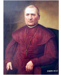
Foto: biskup Štefan Moyzes

Od roku 1918 ale predovšetkým od roku 1948 sa celé dejiny slovenského obrodzenia prevrátili o 180 stupňov. Za obrazom katolíckych kňazov a biskupov, luteránskych slavjanofilov a obdivovateľov samodržavia, za odporcami feminizmu a masarykovského humanizmu, sa začali krvopotne a umelo hľadať nejaké „revolučné“ živly, ktoré tam neboli. A tento pokrytecký kameň (spolu s ďalšími fikciami z rokov 1918, 1944, 1948, 1968 a 1989) leží slovenským dejinám na bruchu, alebo v bruchu ak chcete, tak, že si nemôžu nijako slobodne odgrnúť. Ak totiž existuje niečo ako národný charakter alebo inštinkt, tak potom je jeden prvok, ktorý sa v slovenskom národe opakuje s nehynúcou pravidelnosťou – tajomná príťažlivosť uprednostnenia zachovávanía (konzervovania) pred zmenou. Skrátka – nerevolučnosť. Čím skôr pochopíme vlastný naturel a prestaneme sa hrať na pokrokových, liberálnych a demokratických, tak tým skôr sa nám uľaví. Ak nie, tak potom je ešte jedna možnosť ako si uľaviť – prestať byť Slovákmi. A na tom sa už tiež pracuje.