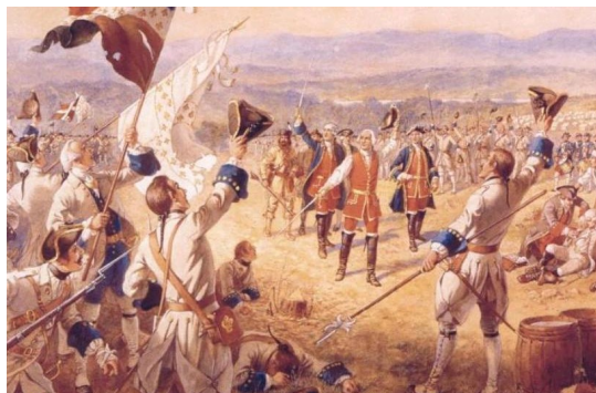
Radosť Francúzov z víťazstva v jednej z mnohých bitiek

Ešte menej reflektovanou, ale významnou (pre katolíka dokonca najvýznamnejšou) okolnosťou celého konfliktu bolo jeho náboženské pozadie a jeho dopad na vývoj katolíckej moci v Európe. To všetko je dnes zahalené modernou historickou interpretáciou, ktorá vníma 18. storočie jednoznačne len ako dobu osvietenstva, racionalizmu a predohry Francúzskej revolúcie, zabúdajúc, že tieto trendy boli skôr záležitosťou úzkeho okruhu elít než širokých mäs. Politické a ekonomické motívy a dôsledky tejto vojny sú brané ako smerodajné, náboženské sú bagatelizované. Pod literárnou a encyklopedickou škrupinou osvietenského zárodku moderného pohanstva sa však ešte stále odohrával náboženský spor medzi katolíkmi a protestantmi, ktorý sa začal v 16. storočí. K nemu sa pridružili všetky ďalšie hospodárske, koloniálne a dynastické záujmy, ktoré nakoniec náboženské pozadie vojny prekryli tak, že nám uniká.