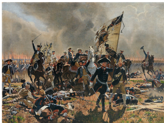
Pruský kráľ Fridrich II.

Pred zrakom vydesených Britov, ktorí svoje národné šťastie spojili navždy s predstavou rozoštvanej kontinentálnej Európy, voči ktorej hrá Británia úlohu „ jazyčka na váhach “, a pridáva sa podľa svojej potreby raz na tú, raz na onú stranu, sa začali rysovať nevábné kontúry súvislého kontinentálneho pásma katolíckych mocností, zviazaných dynastickým putom Bourbonovcov a Habsburgovcov, ktoré sa neskôr aj reálne naplnilo v roku 1770 pri sobáši princa Ľudovíta (neskôr popraveného Ľudovíta XVI.) a princeznej Márie Antónie, dcéry Márie Terézie. Tento pre nich nepriateľský priestor by sa rozkladal v podstate ešte na väčšom území, než aké mala habsburská ríša v 16. storočí. Zahŕňal by územie Južnej Ameriky, severoamerických francúzskych kolónií v Louisiane a v Québecu, Španielsko, Francúzsko, Svätú rímsku ríšu, Uhorsko, časti Talianska ako aj francúzske a španielske kolónie v Ázii a Afrike.