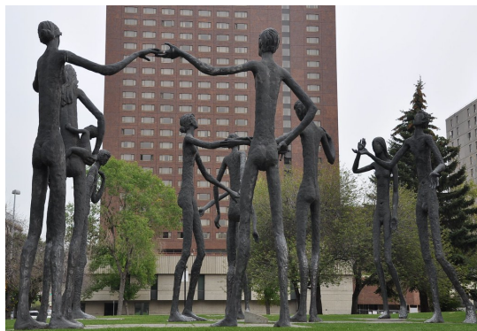
Súsošie ľudského bratstva v Calgary

Ako sa medzi katolíkmi bežne vie (alebo vedelo): diabol je opicou, ktorá napodobňuje Boha a ašpiruje na Jeho pozíciu. Z toho ľahko odvodíme, že taktika večného revolucionára nebude operovať len s popieraním Božích zákonov a daností, ale aj s ich parodovaním a prekrúteným napodobovaním. Chaos, ktorý tým vznikne, potom využije na lovenie dušičiek.