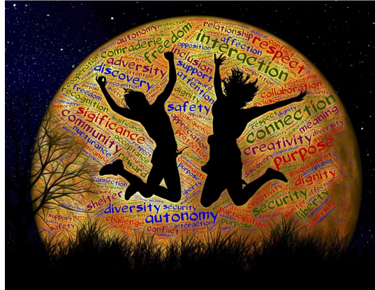
Ilustračný obrázok, zdroj: Needpix

rodiny, je krajne rojčivé. Znamená to doslova dúfať v niečo, čo nie je možné a čo je ako idea v konečnom dôsledku podozrivé. Kto by totiž túžil zaangažovať miliardy ľudí, obrovské finančné, surovinové, kultúrne a ďalšie zdroje do projektu, ktorý je na základe všetkej ľudskej skúsenosti, zjaveného kresťanského náboženstva aj elementárneho odhadu odsúdený vopred na nezdar? Nebolo by rozumnejšie dúfať skôr v relatívne uskutočniteľné tlmenie následkov dedičného hriechu medzi štátmi a národmi tými formami, akými fungovalo doteraz?