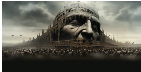
Ilustračný obrázok, zdroj: DeviantArt

Zatiaľ to všetko vyzerá skôr na variant číslo 2. Dušičky (vrátane tých naivných katolíckych) sú v mene zámeny ideálu katolíckej vieroučnej jednoty za ideál globálnej politickej a sociálnej jednoty ochotné radostne bežať svetlým zajtrajškom v ústrety. Hovoríme „zámeny“, pretože ako môžeme pozorovať: prijatím globalizačného ideálu sa nám akosi vytratil z katolíckych hláv, úst a dokumentov, a to aj na tých najvyšších miestach, ideál všeobecného obrátenia ľudstva na katolícku vieru. Čiže už nepočujeme ani to, čo bolo predmetom omylu predchádzajúcich generácií zmätených katolíkov, že po obrátení ľudstva na katolícku vieru nastane globálna politická a sociálna jednota, ale, a to je podstatné a varovné, počujeme, že najprv sa treba zjednotiť, bez ohľadu na náboženstvo, národnosť, rasu, dejiny, kultúru aj skúsenosť.