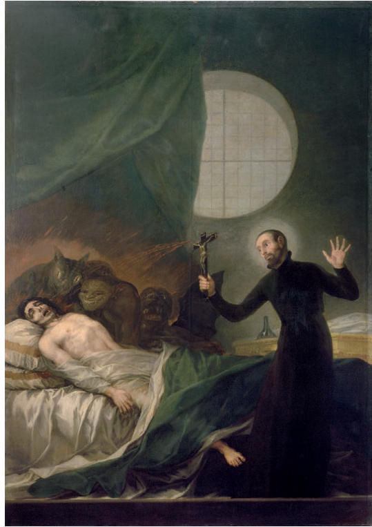
Francisco Goya, Svätý František Borgia SJ s krucifixom chráni dušu umierajúceho pred démonmi

Kto si nechce poklknúť a argumentuje svojou cťou je ako hlúpy páv, namyslený na svoju krásu, pyšný a samolúby. Kto zostane vo svojej pýche, bude kvôli pýche aj potrestaný rovnako, ako bol potrestaný zlý duch, knieža a otec lži, otec všetkých pyšných a zavrnutých.