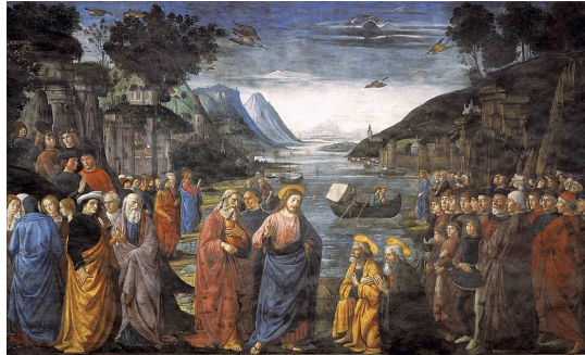
Domenico Ghirlandaio, Kristus si vyvolil Apoštolov (Sixtínska kaplnka)