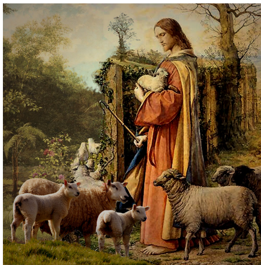
Ježiš Kristus, dobrý pastier