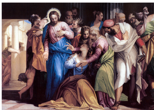
Paolo Veronese, Obrátenie Márie Magdalény

S rovnakou súcitnou dobrotou a bez jedinej výčitky prijíma ľútosť Magdalény, ktorá bola veľkou hriešnicou. S láskou pozeral na jej očistný plač pri jeho nohách, odpustil jej hriechy a z hriešnice Magdalény sa stala Mária Magdaléna, po Panne Márii jedna z najsvätejších žien v celom Evanjeliu.