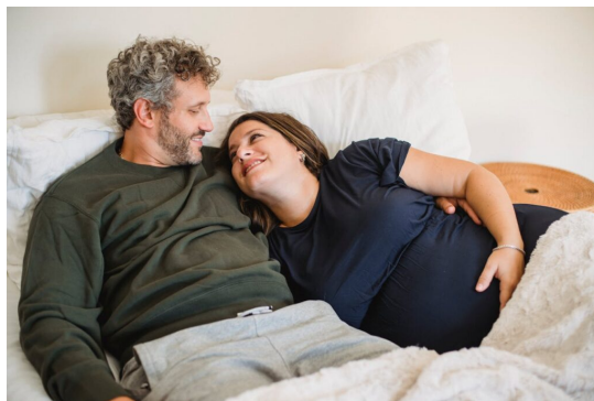
Ilustračný obrázok

Jedno z tvrdení šíri predstavu, že ženy v katolíckych rodinách potláčajú svoju sexuálnu túžbu a pohlavný pud na základe tlaku katolíckeho morálneho učenia, a to už od počiatkov Cirkvi, pričom primárnym podnetom k tomu je večné bazírovanie Cirkvi na predmanželskej čistote. Tento tlak sa údajne prenáša po sobášu aj do manželského života a brzdí pohlavnú vášeň medzi manželmi. Druhé tvrdenie šíri blud, že manželia si nie sú vzájomne povinní byť sexuálne po vôli. Pristavme sa najprv pri prvom tvrdení.