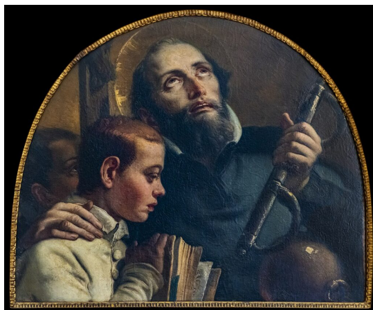
Giandomenico Tiepolo, Sv. Hieronym Emiliani

Táto odlúčenosť od sveta mu otvorila oči. Začal premýšľať o svete a jeho márnostiach. Často volal vo svojej osamelosti v žalári: «Aké obete som priniesol pre bláznivú a namyslenú vojenskú česť! A ako málo činil som posiaľ pre Teba, ó Pane, pre svoju biednu dušu a pre večný život! Aby som zavčasu hodnosť dosiahol a po niekoľko rokov ju podržal, nespával som toľké noci, ako vojak som vzdoroval toľkým nebezpečenstvám. A aby som večnú hodnosť dosiahol, bola mne nešťastnému každá obeta priveľkou, každého času drahou!» Toto rozjímanie ho priviedlo k tomu, že skrúseno modliť sa začal. I prosil preblahoslavenú Pannu o príhovor, žeby ho Boh čím skôr z väzenia vyslobodil; i urobil sľub, že po vyslobodení do Trevisa putovať bude, hriechy svoje kajúcnosťou obmyje a život svoj službe Božej zasväťí.