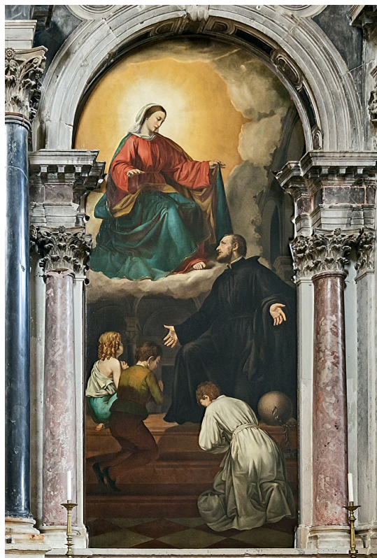
Obraz v Kostole Navštívenie Panny Márie v Benátkach zobrazuje sv. Hieronyma Emilianiho ako zveruje siroty do opatery Panny Márie

Kúpil teda dom a v ňom zhromažďoval tieto opustené siroty, staral sa o ich zasytenie, odev a kresťanské vyučovanie. Neskôr založil takéto opatrovne pre opustené deti i v mestách Brescii, Bergame a inde. Zbožný Hieronym vedel, že po talianskych mestách panuje veľká necudnosť. Prosil vrchnosť, aby tomu prietrž urobili a verejné necudné domy pozatvárali. Sám založil domy, v ktorých padlé kajúcne dievky útočište našli. Mnoho osočovania a prenasledovania musel pre toto znášať; ale svätý muž podstúpil rád tento boj, keď len duše pre večnosť získať mohol. Biskup dovolil mu, žeby mohol po mestách a dedinách zanedbaných kresťanov vo sv. náboženstve vyučovať. Toto účinkovanie pohlo mnohých kňazov a svetských ľudí k tomu, že jeho príklad nasledovali. Zakrátko sa pripojili k nemu ďalší.