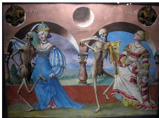
Ilustračný obrázok

Úbohé duše. Prečo sa len tak náhlite v ústrety Peklu? Pre Božie milosrdenstvo, zastavte sa a počúvajte ma chvíľu. Chápete, čo to je byť večne spasený a večne zatratený? Ak to chápete a napriek tomu nechcete zmeniť svoj život, dobre sa vyspovedať, odvrhnúť svet a vykonať všetko, aby vás započítali medzi malý počet spasených, tak vám hovorím, že nemáte vieru. Ak tomu nerozumiete, tak vás možno skôr ospravedlniť, pretože zjavne nie ste pri zmysloch. Byť spasený alebo zatratený po všetky veky a nevykonať všetko, aby ste dosiahli to prvé a vyhli sa tomu druhému, to je niečo nepredstaviteľné.