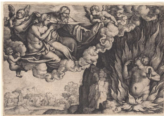
Ilustračný obrázok, Lazár a boháč

Nie márnou snahou, ale spásnym napomínaním, je kázať isté pravdy, ktoré skvelo pomáhajú proti ľahostajnosti liberálov, ktorí vždy rozprávajú o Božom milosrdenstve a o tom ako sa tí, čo žijú v najrôznejších hriechoch a pochodujú po ceste do Pekla, môžu ľahko a bez ťažkostí obrátiť. Aby som ich vyviedol z omylu a prebudil zo spánku, preskúmajme teraz túto veľkú otázku. Je viac kresťanov spasených alebo zatratených?