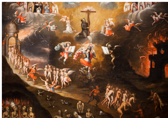
Ilustračný obrázok, zdroj: flickr.com

Žijeme v neľahkej dobe. Útoky na pravdy našej svätej a katolíckej viery prichádzajú zo všetkých strán a v poslednej dobe takmer neprestajne aj zvnútra, od prominentných členov hierarchie. Tu počujeme od jedného kardinála, že Peklo bude nakoniec prázdne, tam pápež hovorí, že si rád prázdne Peklo predstavuje, tam iný dôležitý arcibiskup spochybňuje Nepoškvrnené panenstvo a Pravú prítomnosť, inde zasa počujeme kardinála, ktorý hovorí, že Adam a Eva sú len bájky, tam zasa Rímsky biskup vo svojej knihe tvrdí, že vinu za Kristovu smrť nesmieme pripisovať Židom, iný kardinál zas hovorí, že ani Židom ani kacírom nie je treba konvertovať na katolícku vieru, aby sa zachránili, tam sa zas biskupská konferencia kedysi dôležitého kresťanského národa organizuje spoločnú ekumenickú oslavu výročia reformačnej vzbury toho arcikacíra Luthera, inde biskupské konferencie rušia katolícke sviatky, ale zavádzajú dni židovstva, oslavujú konce Ramadánu a vyhlasujú „prájd“ mesiace pre LBTXYZ+, na opačnom konci sveta sa usporadúvajú cirkevné dni slobodomurárstva, v Afrike zasa počujeme istú biskupskú konferenciu, ako požaduje odstrániť z ústavy štátu zmienku o tom, že je kresťanský a tu zasa počujeme Rímskeho biskupa rozprávať o tom, že moslimovia majú právo na náboženskú slobodu.