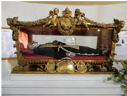
Zachovalé telo sv. Leonarda z Porto Maurizio