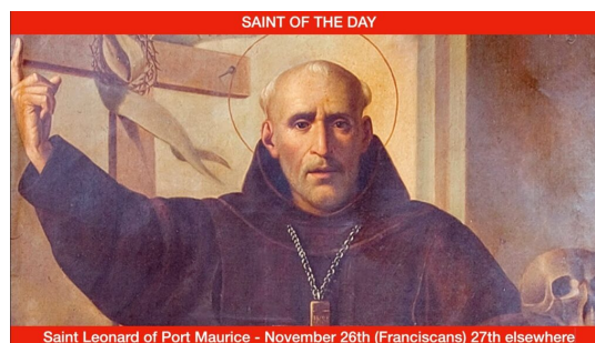
Sv. Leonard z Porto Maurizio

Bratia, musíte predsa vedieť, že najstaršia viera je Boží zákon a že my všetci ho máme vpísaný do srdc, takže ho možno spoznať aj bez učiteľa a že stačí svetlo rozumu, aby sme poznali príkazy Zákona. I pohania sa skrývajú, keď spáchajú hriech, pretože vedia, že urobili zle. Zatratení sú, pretože nezachovávali prirodzený zákon zapísaný v ich srdciach. Ak by ho zachovávali, Boh by spravil zázrak a nezatratil ich. Učinili sa však nehodnými Božej pomoci, keď nežili v zhode s vlastným svedomím, ktoré ich bezpečne varovalo pred zlom, ktorému sa mali vyhýbať a viedlo ich k dobru, ktoré mali konať.