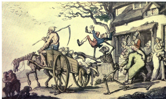
Ilustračný obrázok, zdroj: flickr.com

schovávame odmenu, ktorú vám odovzdáme, keď prídete za nami do Pekla.“