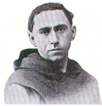
Sv. Ezechiel Moreno Diaz

V meste Las Piñas sa stal kňazom, ktorého milovali doslova všetci obyvatelia, a keď sa miestny biskup rozhodol, že Morenu preloží do mesta Santo Tomás v regióne Batangas, postavili sa mešťania Las Piñas rozhodne proti jeho preloženiu. No samotný sv. Ezechiel Moreno Diaz sa svojim farníkom z Las Piñas poďakoval za ich podporu a preukázanú dôveru a poprosil ich, aby neboli proti jeho preloženiu a akceptovali jeho poslušnosť k nariadeniam biskupa. Od roku 1880 pôsobil v kostole Santa Cruz v Santo Tomas. Tu opäť ochorel na maláriu a dokonca to vyzeralo tak, že tentokrát záchvat malárie už neprežije. Milostivý Boh však s ním aj teraz mal iné plány a aj z tejto choroby sa sv. Ezechiel Moreno Diaz vyliečil.