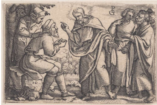
Kristus lieči slepého muža

Samotný apoštol sv. Matúš vo svojom Evanjeliu hovorí, že Náš Pán Ježiš Kristus uzdravoval každý neduh: 23 A Ježiš chodil po celej Galilei, učil v ich synagógach, hlásal evanjelium o kráľovstve a uzdravoval každý neduh a každú chorobu medzi ľuďom. 24 Povest' o ňom sa rozniesla po celej Sýrii. Prinášali k nemu všetkých chorých, postihnutých rozličnými neduhmi a trápením, posadnutých zlými duchmi, námesačníkov a ochrnutých, a on ich uzdravoval. 25 A šli za ním veľké zástupy z Galiley a Dekapola, z Jeruzalema, Judey a Zajordánska. (Mt 4, 23)