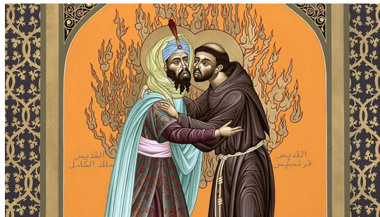
Ilustrační obrázek

Opojení rovností vede ke vznášení požadavku radikální inkluze , která by se měla v Církvi uskutečňovat přímo nekompromisním způsobem. Od nemalého počtu aktérů synodality patrně stále častěji uslyšíme, že Církev by se měla stát místem setkávání odlišností, modelem pluralitní společnosti, v níž v klidu a pokoji koexistují lidé nejrůznějších názorů, životních postojů a náboženských přesvědčení. Kde jinde než v Církvi realizovat izajášovskou vizi , podle níž se beránek bude spokojeně pást vedle vlka a žádný strach ho přitom nebude sužovat? Kde jinde než v Církvi by měla být přítomna láska, která obejme úplně všechny a otevře své brány dokonce i jinověrcům a ateistům? Nepodobá se vyhrazování místa v Církvi pouze katolickým věřícím Kristem kritizovanému konání dobra pouze svým přátelům? Nejednají tak i pohané?