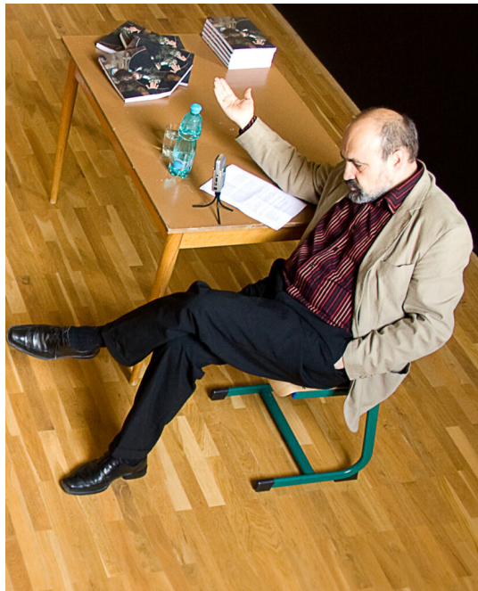
Ilustračný obrázok, zdroj: wikimedia commons

K pochopení těchto základních úvah není potřeba žádného velkého filosofického nebo teologického vzdělání. Stačí k tomu jen prostá víra, která se nenechá zavést na scestí učenými výklady renomovaných znalců křesťanství, jiných náboženství a záležitostí tohoto světa. Existuje totiž dosti významný rozdíl mezi profesorskou znalostí křesťanství a znalostí Krista .