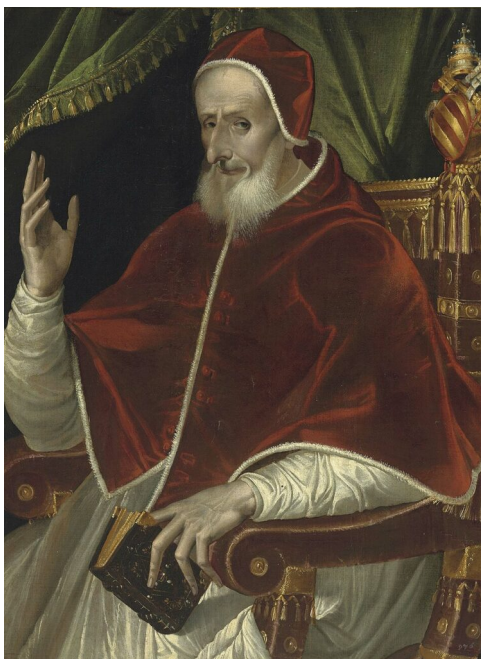
Bartolomeo Passaroti, Portrét sv. Pia V.