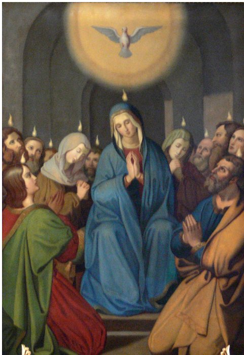
Fidelis Schabet, Zoslanie Ducha Svätého (holubica a ohnivé jazyky)

Čo sa týka cirkevného slávenia sviatku Turíc, tento sviatok sa slávil už od apoštolskej doby. Prvé písomné správy pochádzajú z prelomu 2. a 3. stor., ide o jeden z najvýznamnejších katolíckych sviatkov. V 4. stor. sa začala v predvečer slávnosti Turíc sláviť vigília a oktáva Zoslania Ducha Svätého. Liturgická farba Turíc bola vždy červená, čo symbolizuje nielen ohnivé jazyky a Ducha Svätého, ale aj katolíckych mučeníkov. Ďalším zo symbolov Turíc bola od katolíckeho staroveku aj holubica.