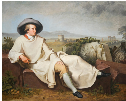
Johann Heinrich Wilhelm Tischbein, Goethe v rímskom okolí (Campagna)

Nie nadarmo boli vyššie uvedené tri slová: titanizmus, démonizmus a satanizmus. Za každým z nich sa skrýva to isté – vzbura. Vzbura proti realite stvorenia, proti následkom dedičného hriechu človeka, vzbura proti Bytiu.