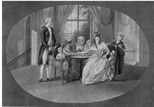
Werther – dobová ilustrácia románu

zastaviť. Všetko, čo je objektom vášne, je dnes posvätné. A skutočne všetko. Ani náboženstvo, ani manželský zväzok, ani štát, ani prirodzenosť a ani zdravý rozum nemajú nikomu rozkazovať. To je skutočná tvár romantizmu.