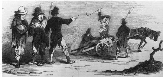
Dobová kresba

V roku 1848, po strašnom roku 1847, mal Trevelyan tú drzosť, že vydal špeciálnu publikáciu Írska kríza (The Irish Crisis), v ktorej s pátosom protestantského kazateľa a apoštola laissez-faire píše, že hladomor bol „priamy úder múdrej a milosrdnej Prozreteľnosti“ a že bol „ostrým, ale účinným liekom, ktorým sa dosiahne uzdravenie“. Trevelyan totiž považoval hospodárske a ekonomické vzťahy v Írsku za krajne negustiózne z hľadiska princípu voľného trhu a tak, dobre najedený a materiálne zaopatrený, ako aj zaopatrený patričnou ideologickou výbavou, poňal veľký hladomor ako zásah všemocnej neviditeľnej ruky voľného trhu a ekonomického nezasahovania na nápravu zvrhnutého írskoho hospodárstva. Ak ho však budeme navyše trochu podozrievať, že jeho protestantská protikatolícka averzia v tomto bohorovnom nazeraní na írske mŕtvolky hromadiace sa po krajine tiež zohrala určitú úlohu, zaiste nebudeme ďaleko od pravdy.