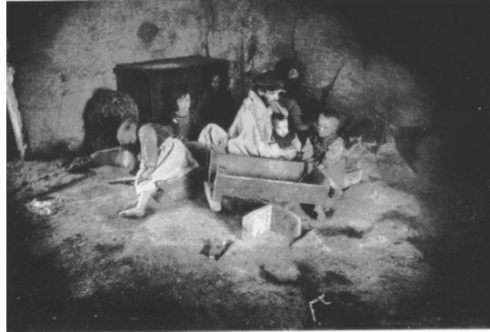
Raritná dobová fotografia írsky rodiny postihnutej hladomorom

No a cca 800 kilometrov od centra tohto pokrokového kolosu sa odohrávali scény, ktoré aj veľmi realistický film Black'47 zobrazuje len v náznakoch. Ľudské bytosti, alebo to, čo z nich zostalo, tam umierali po tisícoch od hladu bez toho, aby im niekto pomohol. Británia bola pritom už vtedy symbolom práve toho spoločenského usporiadania, ktoré dnes tróni na oltári sekulárneho pseudonáboženstva – liberálnej demokracie. Tej liberálnej demokracie, bez ktorej by sa ľudstvo podľa jej veľkňazov prepadlo do skazy.