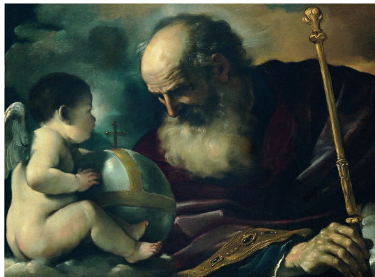
Guercino (Giovanni Francesco Barbieri), Boh Otec a anjel

Táto kolaboračná snaha je eufemicky prikrášľovaná nálepkami o umení možného; o hľadaní toho, čo spája; o slobode, zodpovednosti a spolupráci na konzervatívnom základe; hodnotovej politike a mnohými inými. Starozákonný prorok by to najskôr označil ako smilnenie s cudzími bohmi.